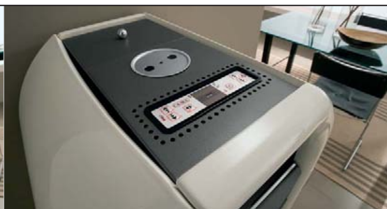
L'arte della ceramica e la tecnologia elettronica più avanzata.