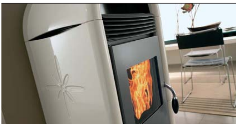
Particolare del decoro sulla ceramica.